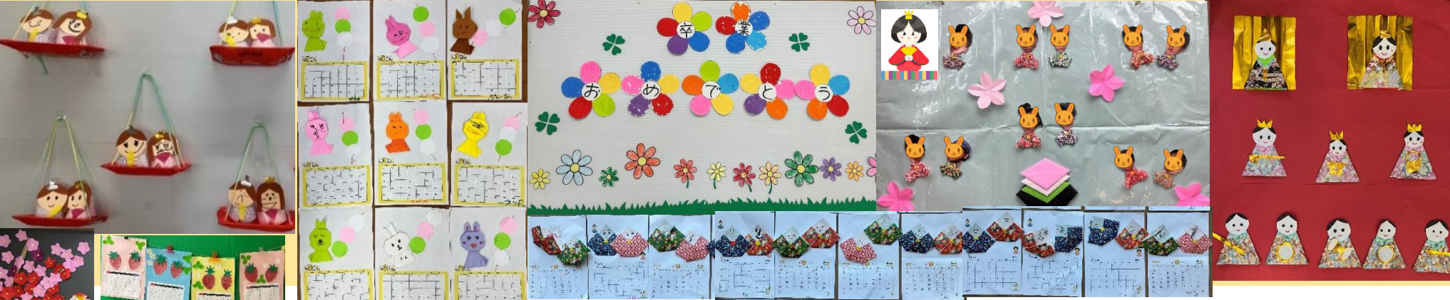
《2月のトピックス（なっつ編）》

3月・・・今月卒業を迎えられる皆さん、ご卒業おめでとうございます。心よりお祝い申し上げます。